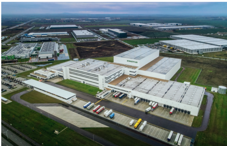
Die Kunden von HABAU kommen aus den verschiedensten Bereichen. Für den Automobilzulieferer Schaeffler baute HABAU bei Halle das Europa-Logistikzentrum mit