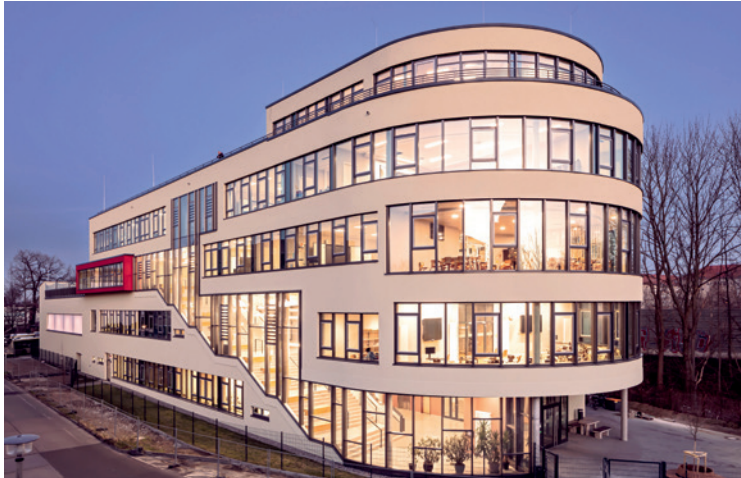
Die Erweiterung der SchuleEins in Berlin-Pankow war ein besonderes Projekt der Habau Deutschland GmbH getreu ihrem Motto 'Wir bauen heute für morgen'